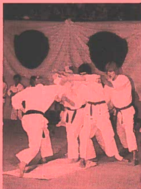
Gennembrydning af en betonblok