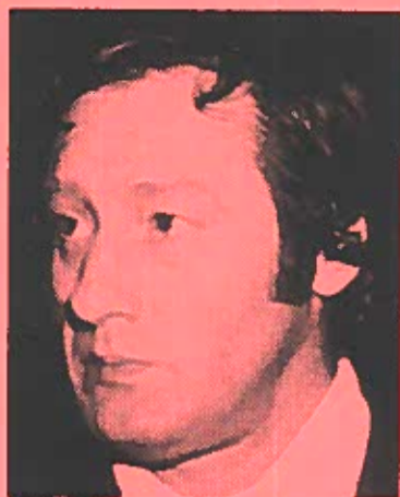
Fra Jon Blumings besøg i København i 1972.