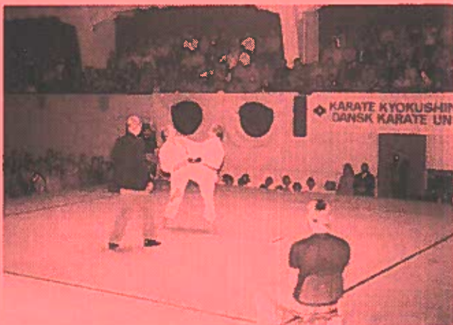
En af de første kampe.